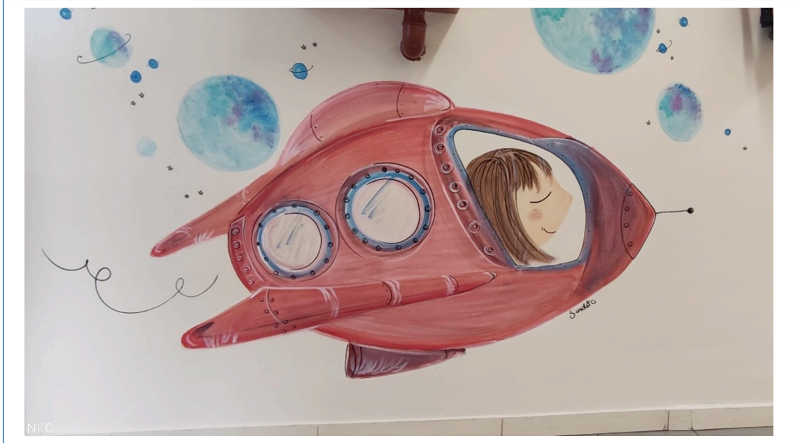
Figura 1. La nave que los lleva hacia la sala de espera

Algunos autores 3 señalan la necesidad de revisar los beneficios sobre la salud que tienen los entornos físicos, lo que nos ayudaría a lograr una nueva perspectiva relacionada con la interpretación y significado que los niños y sus familias dan a los espa-