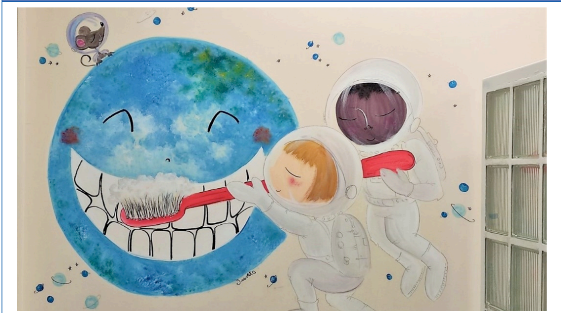
Figura 2. Lavando los dientes al planeta

cios sanitarios. Los espacios sanitarios llevan asociados en sí mismos significados negativos para los pacientes, vinculados con la enfermedad y el dolor. Los espacios físicos cuidados y agradables disminuyen el nivel de estrés y deberían formar