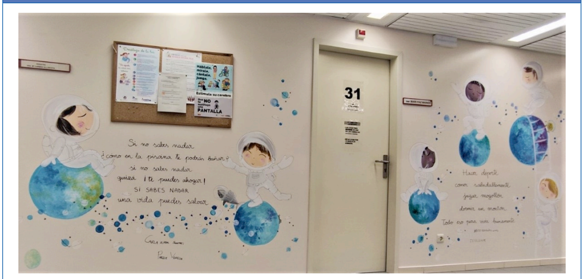
Figura 4. La importancia del deporte y de saber nadar

@josetuitea escribió en su cuenta de Twitter: “La humanización de la asistencia sanitaria no es