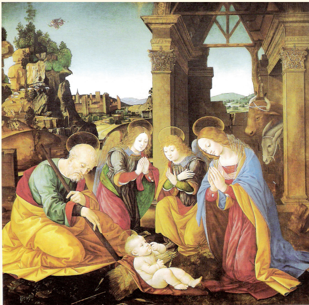
Figura 1. Lorenzo di Credi: La Adoración , 1495-1500 (Galería de La Academia).

El estilo renacentista es reconocible por su realismo; observar la realidad y representarla con detalle se convirtió en la práctica normal de todo artista 5 . Fiel a esta tendencia de su época, Di Credi reflejó cuidadosamente las peculiaridades del niño que le sirvió como modelo para pintar al Niño Jesús y, como resultó que el modelo padecía raquitismo, el artista plasmó magistralmente en la tabla, siglo