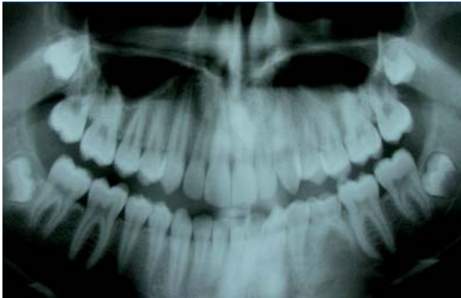
Figura 3. Mesiodens y agenesia del segundo premolar inferior izquierdo a los 13 años.

en la línea media, ligeramente más verticalizado, pero sin cambios significativos en su posición respecto a las radiografías anteriores. Decidimos seguir realizando controles periódicos del supernumerario y lo remitimos a cirugía maxilofacial para la exodoncia de los cordales inferiores por presentar falta de espacio para su erupción. Recomendamos la obturación del molar temporal.