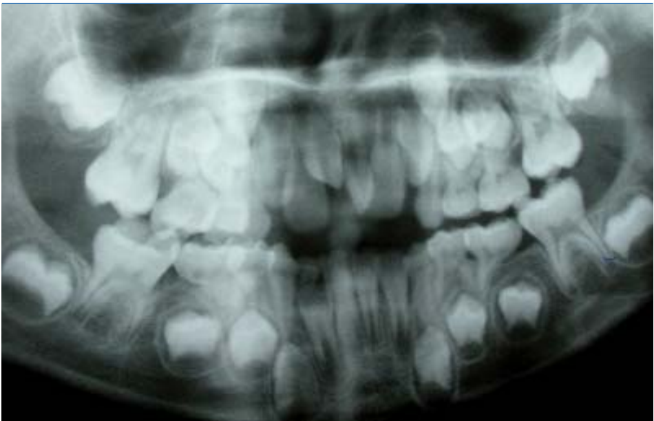
Figura 1. Presencia de dos mesiodens en la línea media.

cisivos superiores sin erupcionar ninguno de los definitivos. En la palpación se apreciaba una tumefacción en el cortical vestibular que correspondía a las coronas de los incisivos centrales superiores, pero éstos estaban localizados muy separados de la línea media. Se solicitó una ortopantomografía para valorar la posición y el estado de la erupción de los incisivos superiores. La radiografía mostraba la presencia de dos mesiodens en la línea media (figura 1). El del lado derecho se encontraba en posición más apical y era de mayor tamaño que el izquierdo. Ambos se hallaban en posición vertical y presentaban una forma conoide. Provo-