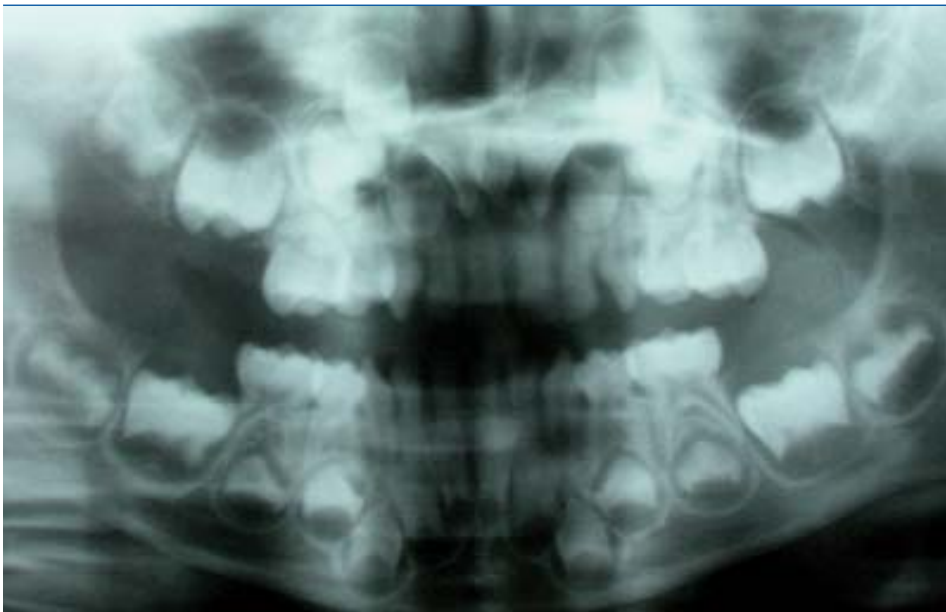
Figura 2. Mesiodens en la línea media y rotación de los incisivos centrales superiores.

Paciente varón de 5 años, sin antecedentes médicos de interés, que acude a la consulta de odontología por presentar una fístula en la mucosa vestibular en el incisivo central superior derecho. El padre refiere que a los 2 años de edad tuvo un